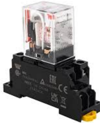
Gambar 3. Relay OMRON 24V

Relay driver adalah rangkaian penguat arus yang digunakan untuk mengaktifkan relay dari sinyal keluaran PLC yang umumnya memiliki arus terbatas. Dengan adanya relay driver , PLC dapat mengendalikan beban seperti pompa atau motor listrik dengan aman [5]. Rangkaian ini biasanya terdiri dari transistor, dioda pelindung, dan relay itu sendiri [6].