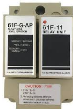
Gambar 4. Water level control (WLC) OMRON 61F-G-AP

Metode on-off control adalah sistem kendali sederhana yang bekerja dengan menghidupkan atau mematikan aktuator berdasarkan batas bawah ( low level ) dan batas atas ( high level ) yang telah ditentukan [7]. Meskipun sederhana, metode ini efektif untuk aplikasi yang tidak memerlukan presisi tinggi dan lebih mengutamakan kestabilan operasi [8].