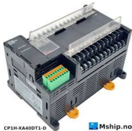
Gambar 1. PLC

PLC adalah perangkat kendali digital yang dirancang untuk mengotomatisasi proses industri dengan keandalan tinggi. PLC memproses sinyal masukan dari sensor, mengolahnya sesuai logika, dan memberikan keluaran untuk mengendalikan aktuator [1]. Keunggulan PLC antara lain fleksibilitas pemrograman, ketahanan terhadap lingkungan industri, dan kemudahan integrasi dengan perangkat otomatisasi lainnya [2]. Pada penelitian ini, PLC digunakan sebagai pengendali utama sistem level cairan dengan metode on-off control .