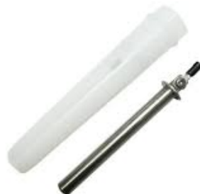
Gambar 2. Sensor Elektroda Lilin

Sensor level elektroda bekerja berdasarkan prinsip konduktivitas listrik cairan. Sistem ini menggunakan beberapa batang elektroda yang dipasang pada ketinggian berbeda di dalam tangki untuk mendeteksi posisi permukaan cairan [3]. Ketika cairan menyentuh elektroda, rangkaian akan menutup dan menghasilkan sinyal masukan ke PLC. Keunggulan sensor elektroda meliputi ketahanan mekanis, respon cepat, dan kemudahan perawatan, sehingga cocok untuk aplikasi industri yang memerlukan deteksi level cairan secara presisi [4].