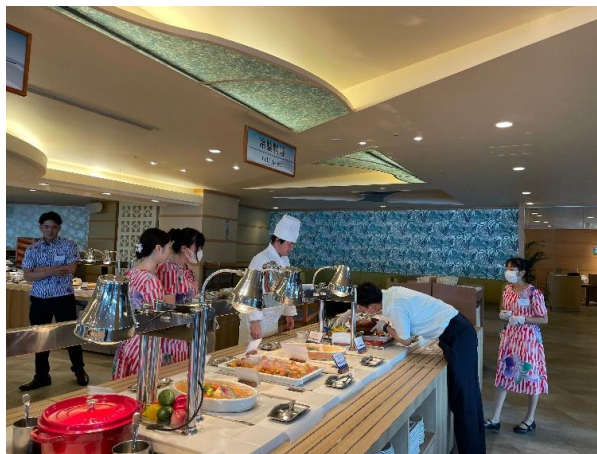
Gambar 2. Staf Restoran Bekerja Sama Saat Jam Sibuk

Integrasi nilai Wa dan Giri juga memperkuat konsep omotenashi pelayanan tulus tanpa pamrih yang menjadi ciri khas industri perhotelan Jepang. Dengan demikian, penelitian ini menegaskan bahwa budaya memiliki peran strategis dalam menciptakan layanan berkualitas tinggi, berkelanjutan, dan berkesan bagi wisatawan internasional.