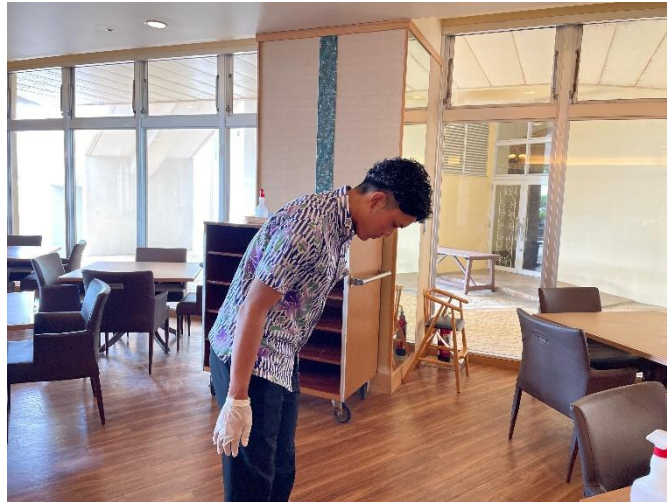
Gambar 3. Sopan Santun Dalam Berbicara dan Gestur