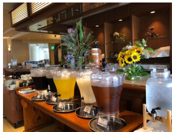
Gambar 3. Hospitableness (Jus Shikuwasa)

Salah satu bentuk nyata dari nilai hospitableness yang diterapkan di Rizzan Sea-Park Hotel Tancha Bay tampak dalam pemberian jus Shikuwasa sebagai minuman selamat datang kepada para tamu yang baru tiba. Tindakan ini tidak hanya sekadar rutinitas pelayanan, melainkan merupakan simbol keramahan khas Okinawa sebuah ekspresi ketulusan hati dalam menyambut tamu layaknya seorang sahabat yang datang dari jauh.