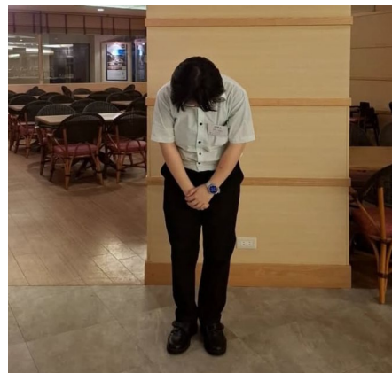
Gambar 2. Aisatsu (Sapaan Sopan)

Tak hanya saat kedatangan, aisatsu juga diberikan saat tamu meninggalkan suatu area, berpindah lokasi, atau saat mereka hendak keluar dari hotel. Ungkapan seperti “ Doumo Arigatou Gozaimashita ” (どうもありがとうございました), yang berarti "terima kasih banyak atas kunjungannya", disampaikan dengan suara lembut dan ekspresi wajah yang mencerminkan penghargaan mendalam. Ucapan ini kembali diiringi dengan ojigi , yang memperkuat makna rasa terima kasih dan perhatian terhadap kesan akhir tamu.